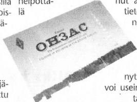
Kortti kertoo myös matkailutietoja Lahdesta.

itse asiassa vain nut asioita, sil-tietoa toimintastamme löytyy verkosta laajasti ja nyt yhteyden voi usein varmentaa sähköisesti niin sanotulla e-